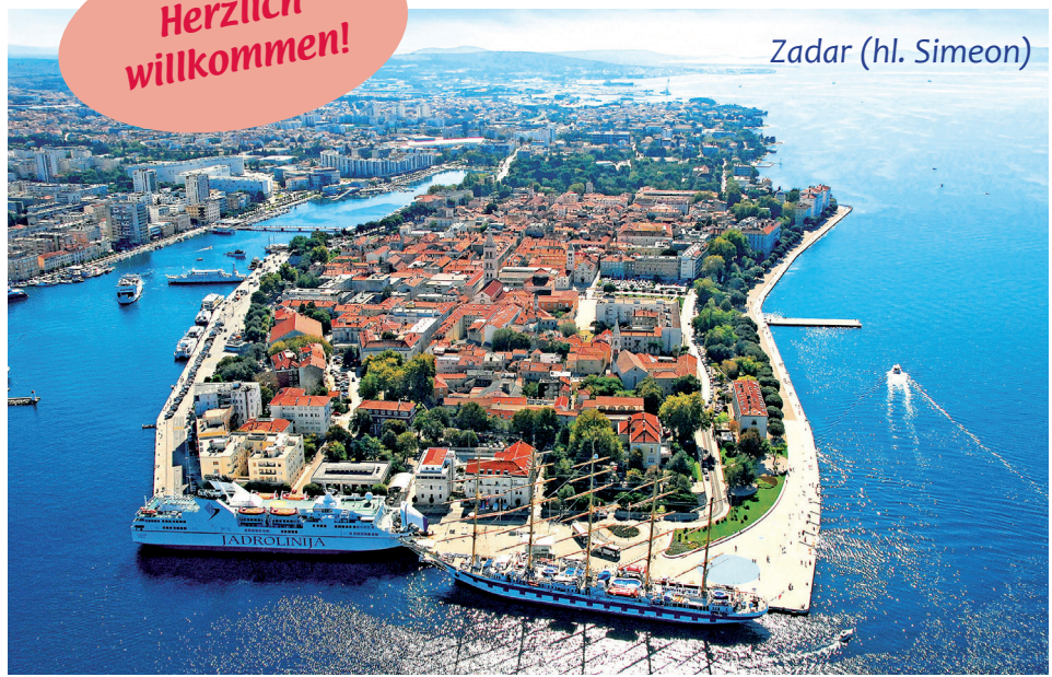
Zadar (hl. Simeon)

Frühzeitige Abreise durch die teils steppenähnliche Hochebene des kroatischen Hinterlandes. Vormittags Ankunft in der auf einer Halbinsel gelegenen antiken Hafenstadt Zadar . Hl. Messe am kostbaren Reliquienschrein des hl. Hohenpriesters Simeon . Freier Mittagsaufenthalt. Nachmittags Fahrt der herrlichen dalmatinischen Küste entlang. Hotelübernachtung an der slowenischen Grenze.